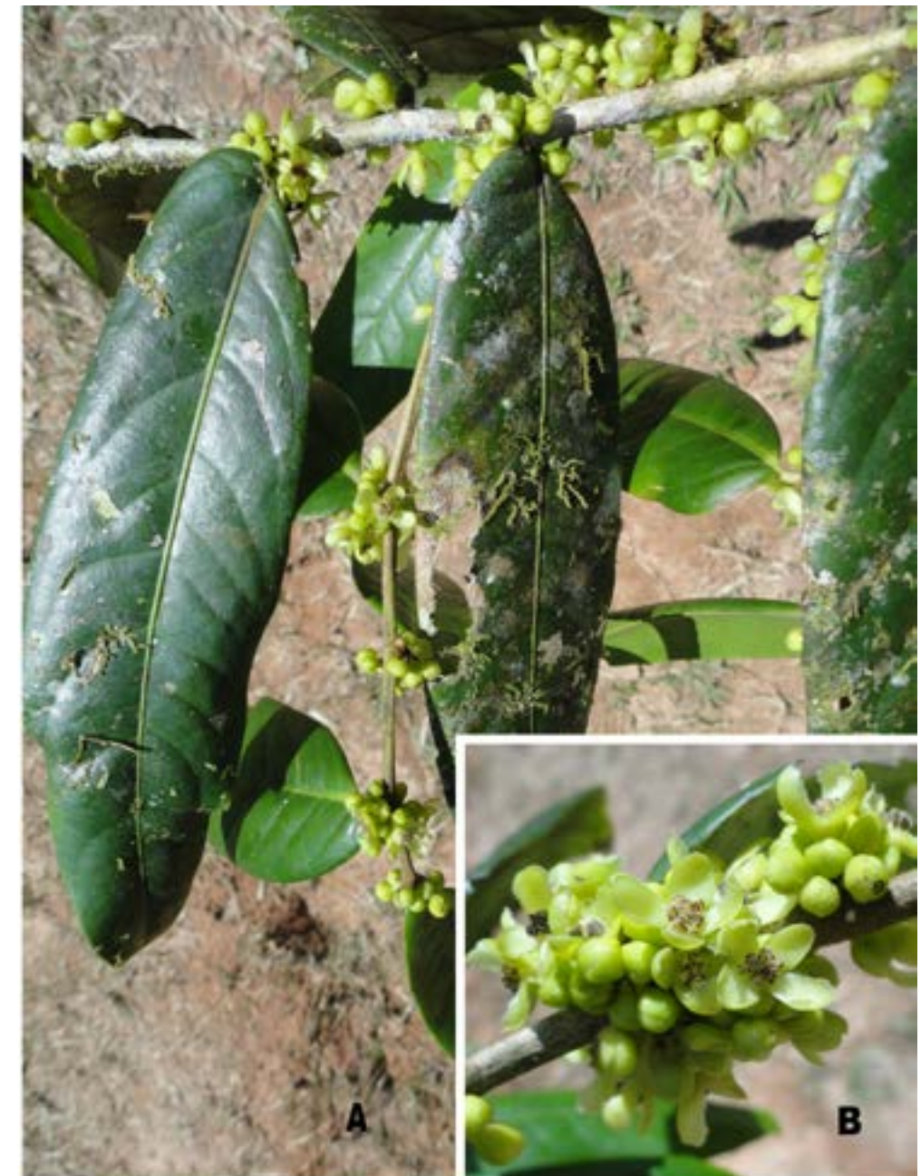
Fig. 2. Drypetes gentryana Vásquez. A. Rama florífera; B. Flores en antésis..