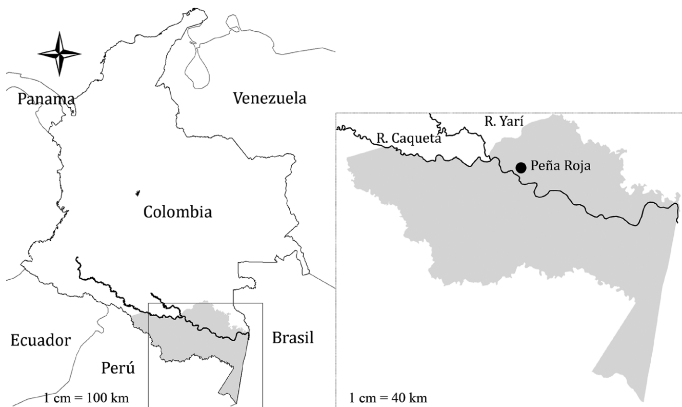
Figura 1. Localización del área de estudio en la región de Araracuara, Amazonia Colombia (arriba).